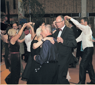
Blick auf die Tanzfläche

Wehrführer Herbert Broy konnte zur Eröffnung des 3. Galaballs der Freiwilligen Feuerwehr Völklingen rund 300 Gäste, unter ihnen Oberbürgermeister Klaus Lorig, in der Ludweiler Warndthalle begrüßen. Diese haben die Veranstaltung zu einem tollen Erfolg werden lassen.