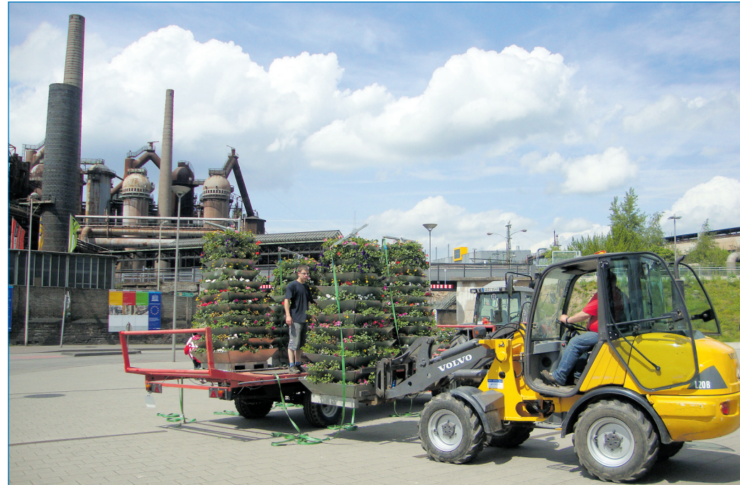
Mitarbeiter der Stadtgärtnerei beim Aufstellen der Pflanzgefäße

In den zurückliegenden Wochen wurden die Pflanzbehälter in den Gewächshäusern der Püttlinger Gärtnerei Scheffler mit Erde befüllt und mit Blumen bepflanzt. Anschließend hat der Sommerflor noch sechs Wochen Zeit anzuwachsen und sich frostgeschützt zu entwickeln. Seit Mitte Mai werden die Blumenpyramiden nach Völklingen transportiert und in einer Großaktion aufgestellt. In diesem Jahr werden 13 Pyramiden, an spätfrostgefährdeten Standorten, erst nach den Eisheiligen auf dem 15. Mai aufgestellt. Die Blumenampeln und -kästen finden nach und nach in den Folgewochen ihren Platz an