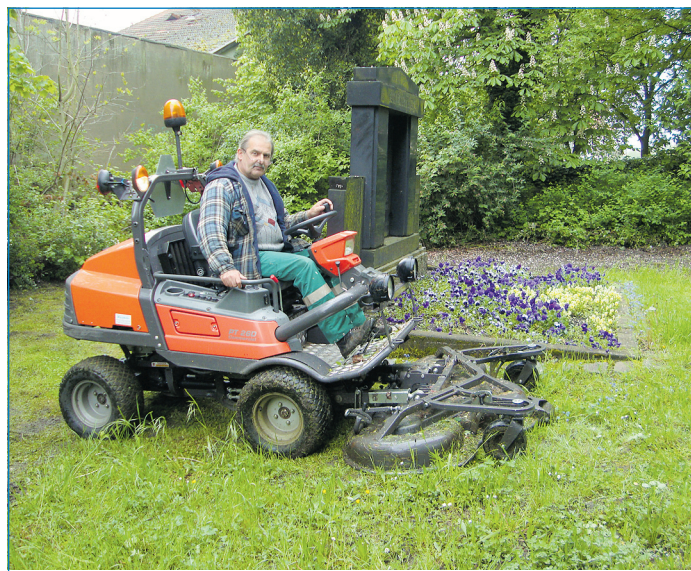
Mäharbeiten im Bürgerpark