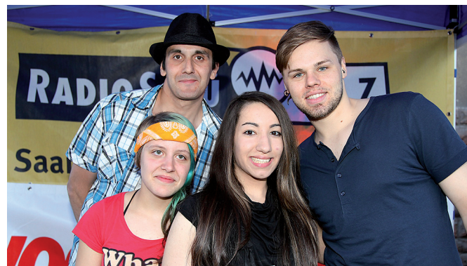
Sieger des letztjährigen McDonalds Song-Contest