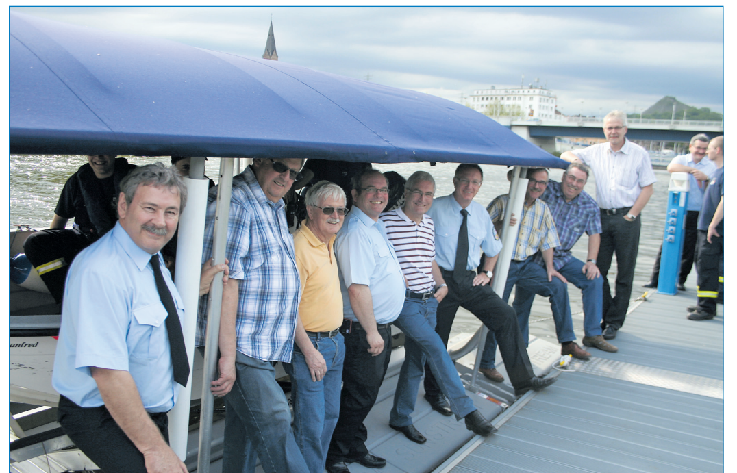
Oberbürgermeister Klaus Lorig freute sich gemeinsam mit Gästen über die neue Einrichtung.

Jetzt wurde der neue Bootsliift an der neuen Schwimmsteganlage im Bereich des historischen Schleusenwärtergehöfts seiner Bestimmung übergeben. Oberbürgermeister Klaus Lorig übergab die Einrichtung ihrer Bestimmung. „Mit der Maßnahme werden in Zukunft Verzögerungen für den Einsatz der Feuerwehr erheblich reduziert“, sagte Lorig bei der Veranstaltung.